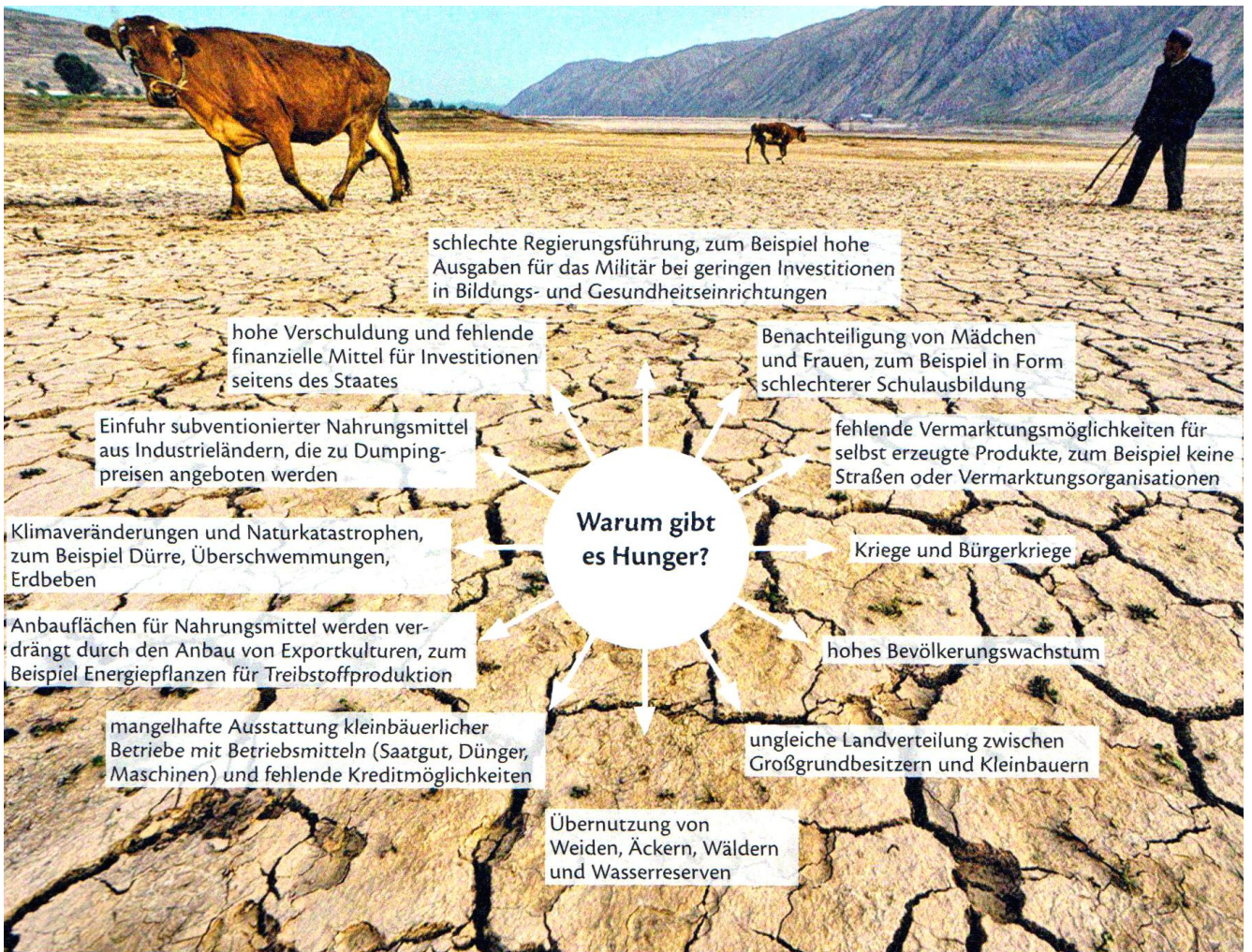
Ursachen von Hunger und Unterernährung